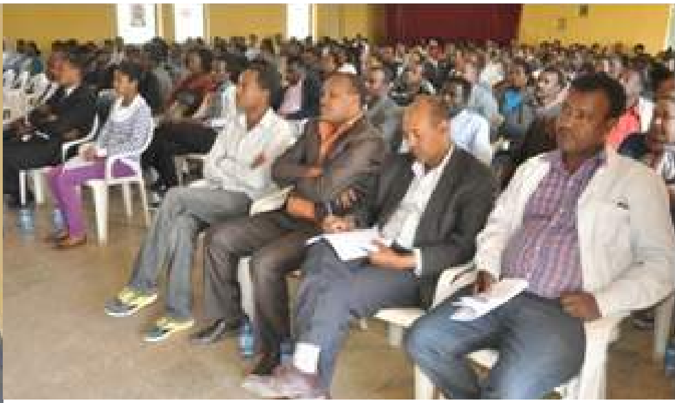
ወደ ገፅ 6 የዞረ